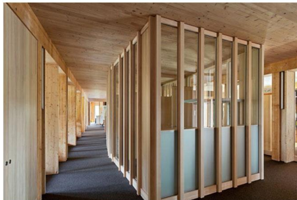
Haus der Bauern, Freiburg im Breisgau